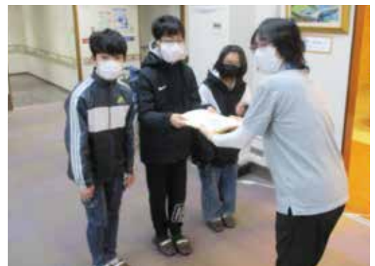
溝口小学校の児童が学校募金を持参してくれました。[社協 溝口支所]