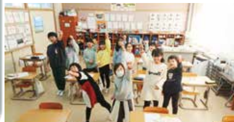
講座終了後は、認知症サポーターの証『オレンジリング』を配布

こんな時どうしたらいいか、相手はどのような思いを持っているのだろうか、を考えながら学習していきました。今回の福祉教育をきっかけに、より「 ふだんのくらしのしあわせ 」について考えながら行動できるようになってもらえたら嬉しいです。